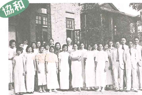
協和小學前身為一所師範學校，圖為協和於一九一六年首屆師範畢業生的合照。