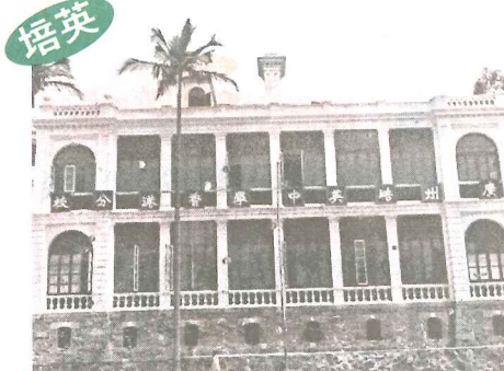
廣州培英中學於一九三七為避戰火，來港設分校，圖為般咸道本港分校的當年外貌。