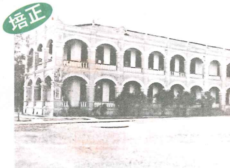
培正中學於東山的校舍在一九〇八年竣工，是為「白課室」。