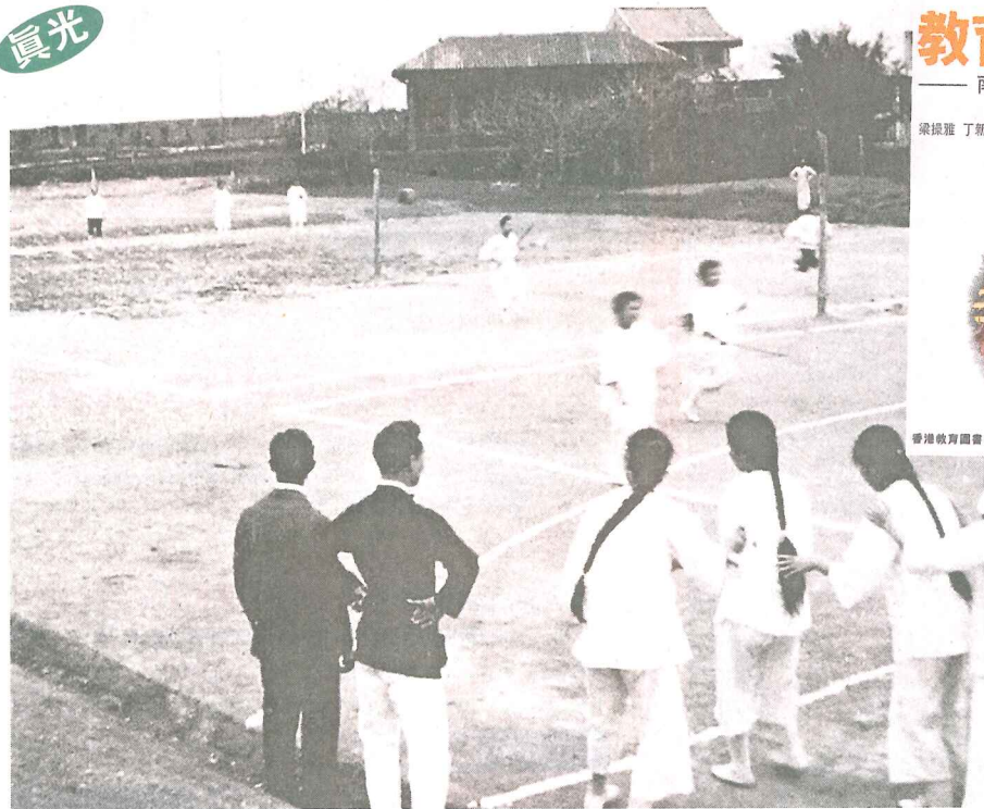
真光於廣州開辦初期，設立體育課，紮腳女生均會參與，圖為一九二四年該校的體育活動。