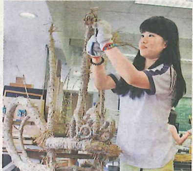
香港培道中學學生細心修剪火龍的禾草，獲師傅讚賞。