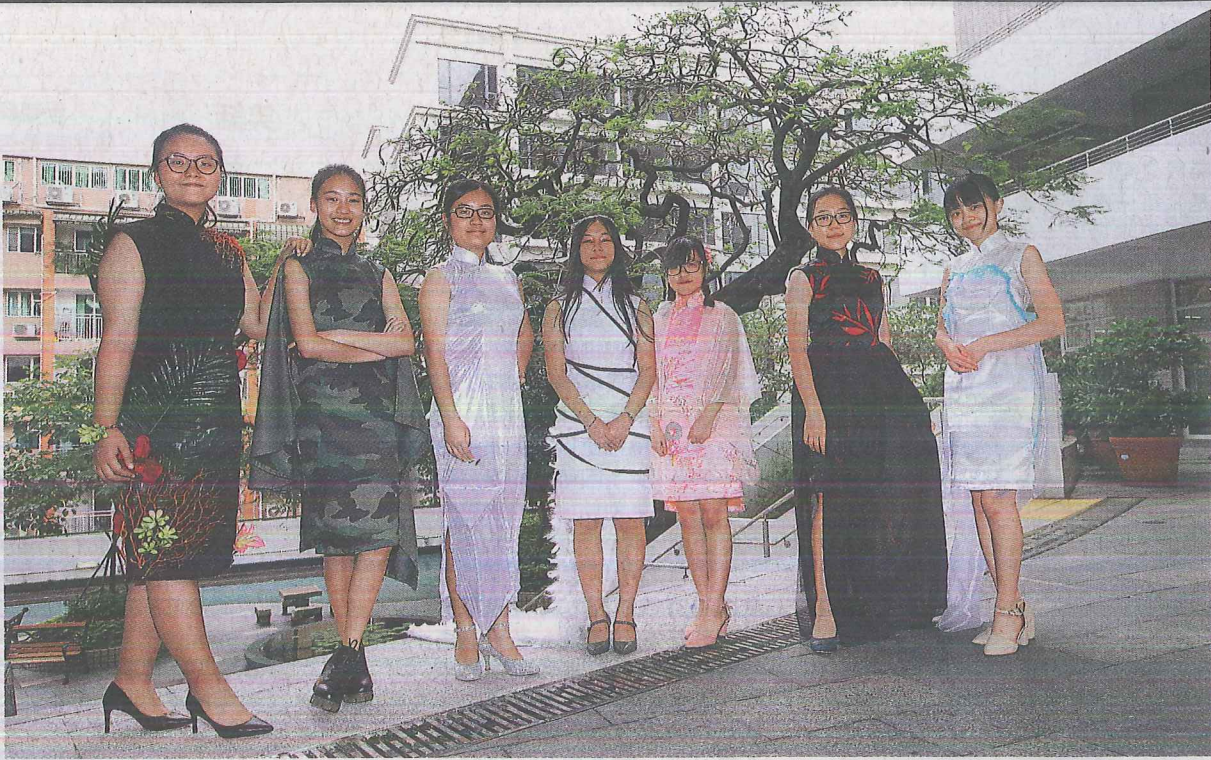
16位同學上週親自穿上自己的旗袍時裝秀，作品都在傳統上變奏，有的加入貼滿羽毛的裙擺，也有同學直接在衫上畫竹和繡上梅花。