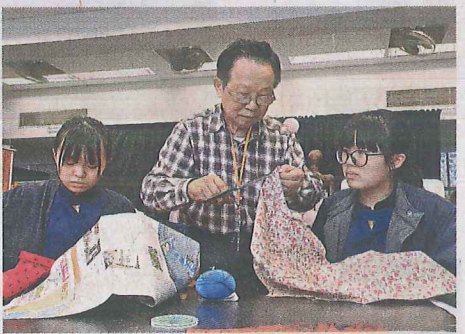
封有才師傳是本地仍在職的最年輕旗袍大師，他按照傳統手法教授，例如會用粉袋彈粉劃綫，要學生用漿糊製作企身的衣領等。