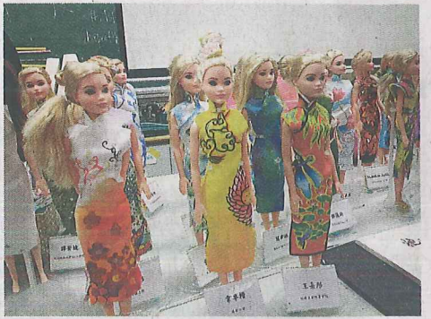
學校早前也舉辦了培道 X Barco 旗袍設計(全港小學)邀請賽。